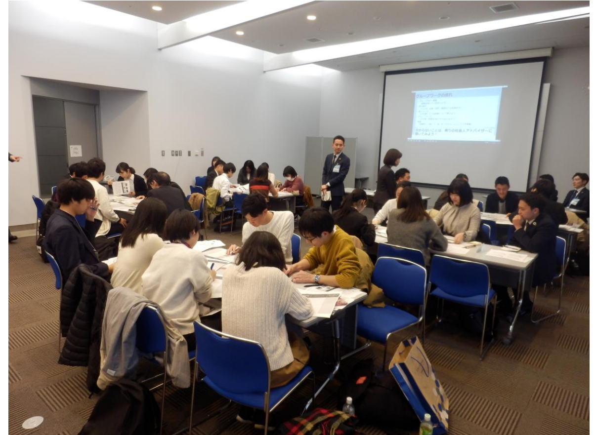
大学と連携して開発したSDGsワークショップと、学生のインターン活動報告会をエコプロ展で開催