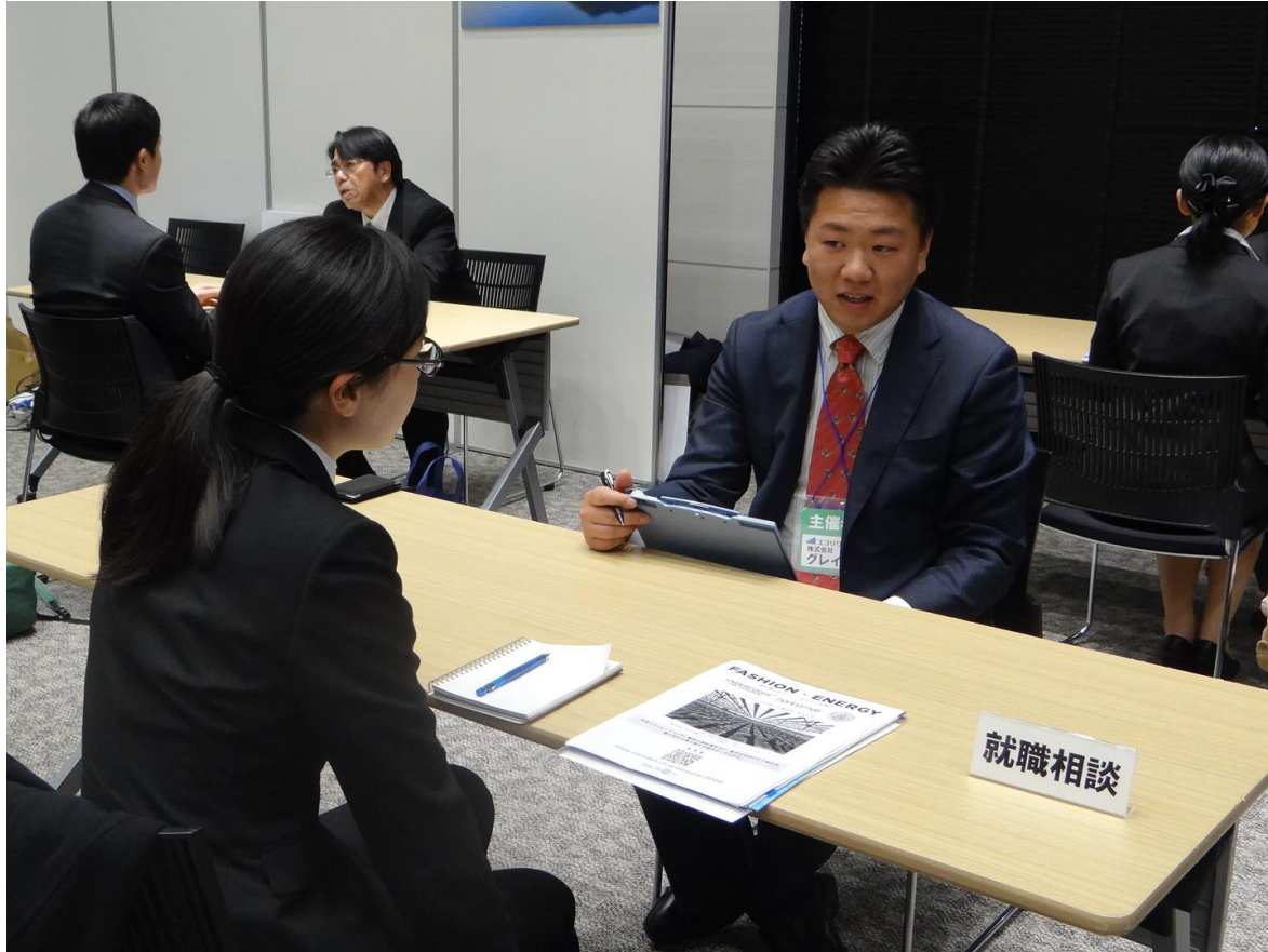
SDGsをテーマとした就職イベントの開催と、キャリアコンサルタントによる就職個別相談会