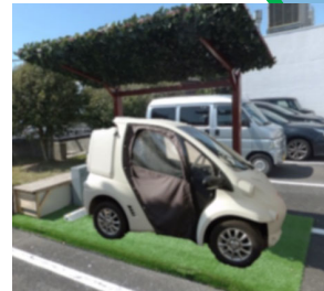
太陽光電池搭載の非接触給電ステーション及びグリーンスローモビリティのイメージ