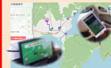
地域交通情報アプリケーションのイメージ