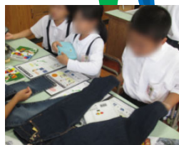
ジュニアジーンズサマリエ (小学生向け出前講座)

((( Wi-Fiが無料で使えます! ))) 高梁川流域フリーWi-Fi 7市町が整備・運用