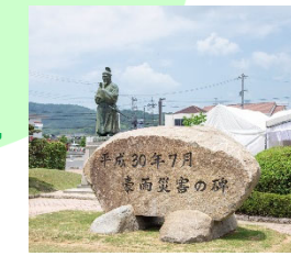
平成30年7月豪雨の碑