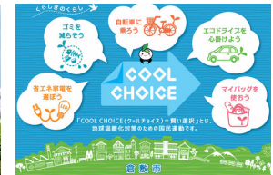
倉敷COOL CHOICE プロジェクト