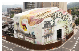
「道後REBORNプロジェクト」で誘客につなげる本館の保存修理工事