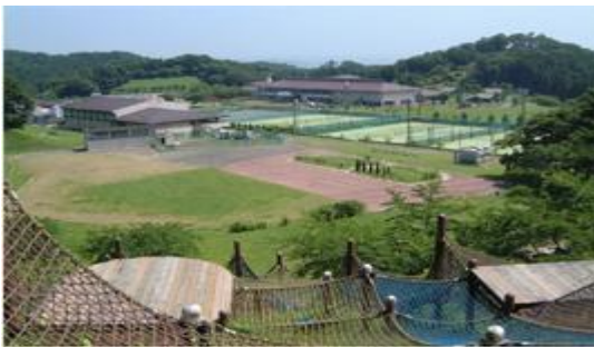
新緑のグリーンピア

平成15年にはグリーンピア岩沼の里山177haを取得。市民に愛される里山として自然環境保全に取り組みながら、健康増進、生涯学習の場として活用している。