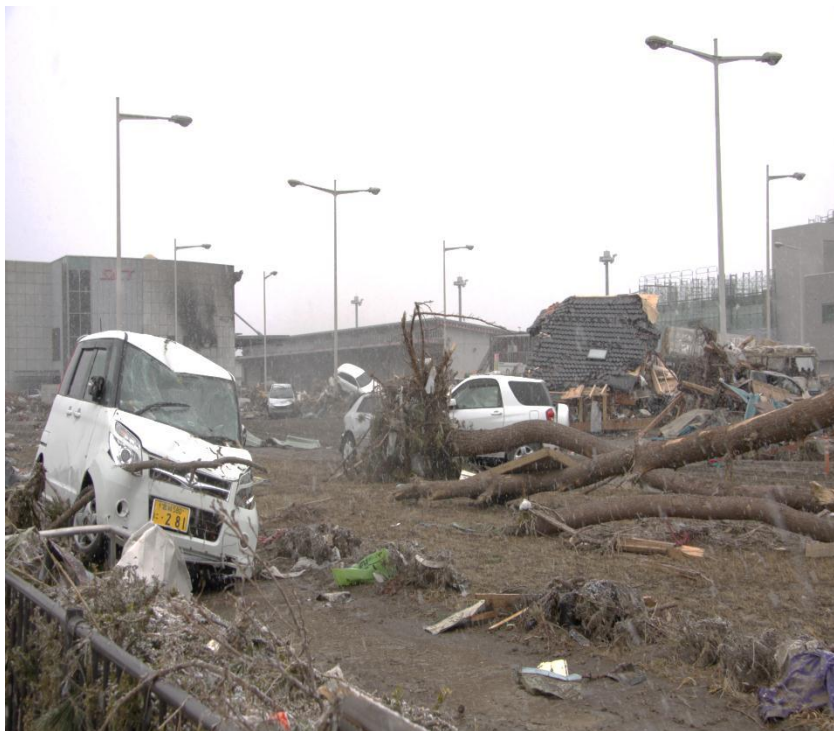
仙台空港ターミナル付近