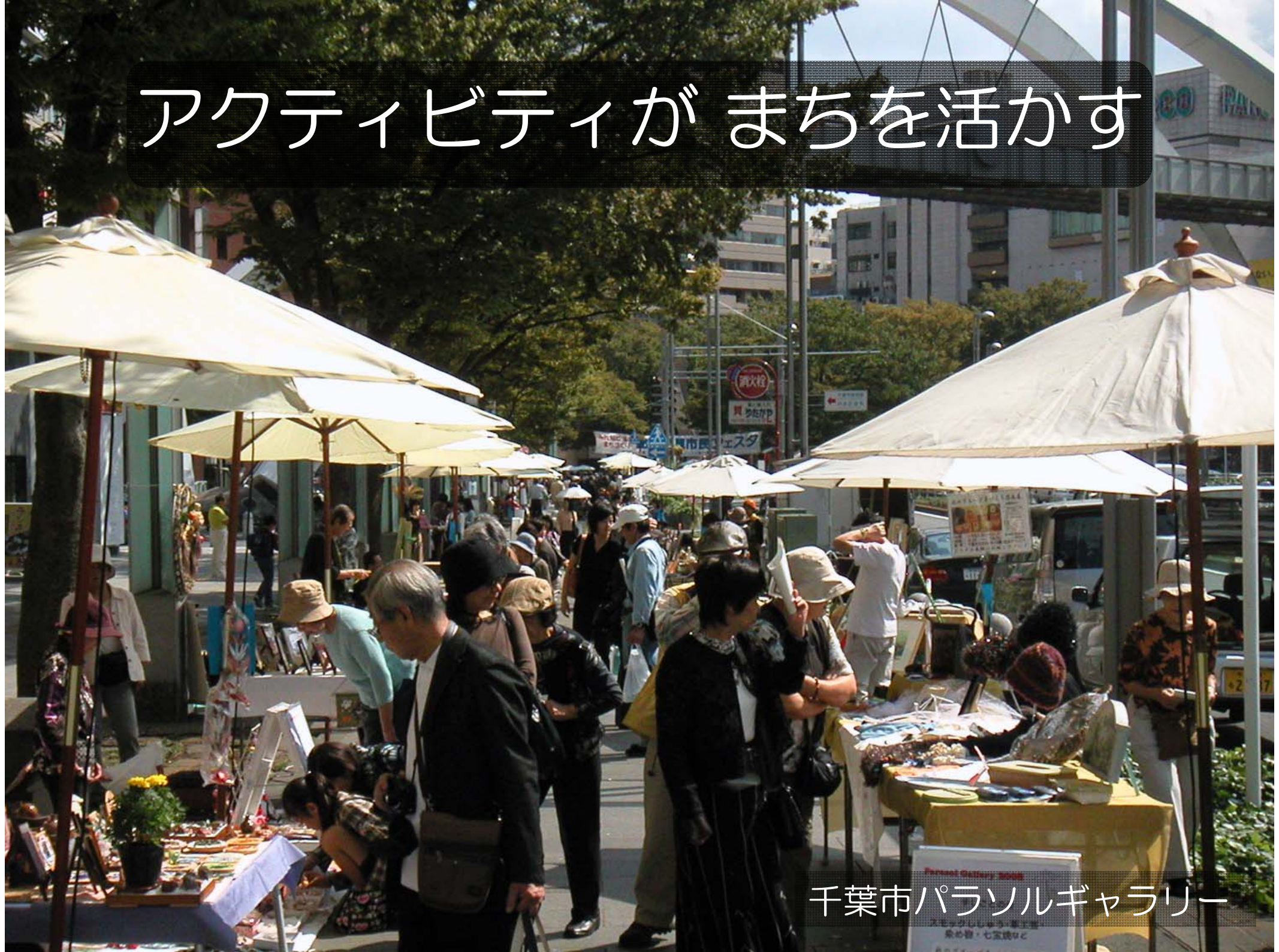
千葉県パラソルギャラリー