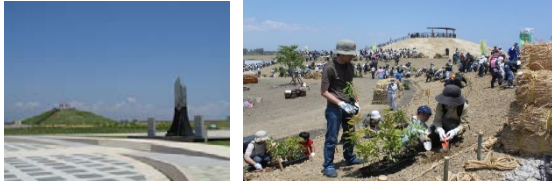
丘は震災により生じたガレキの一部を再生活用して整備を行っている。 右の写真は、園路に苗木を植える植樹祭の様子。