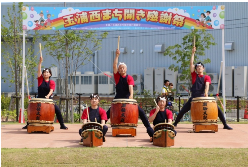
「まち開き」を平成27年7月に実施