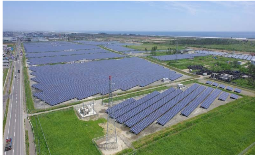
東日本大震災による地盤沈下等で、再生が難しい農地を活用した被災地最大級のメガソーラー