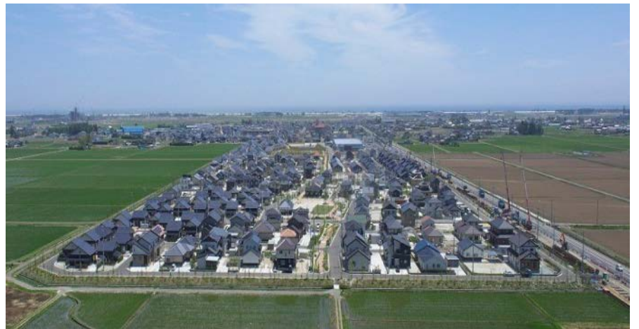
集団移転が実現した「玉浦西」