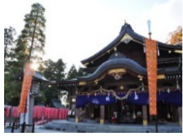
日本三稲荷のひとつ