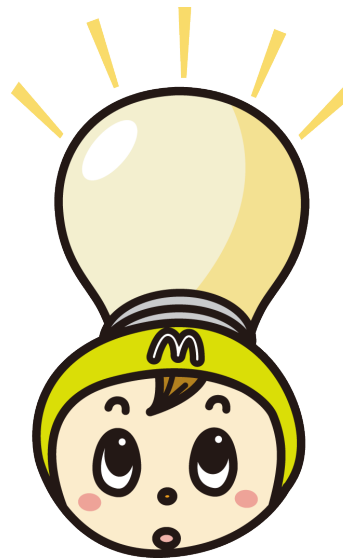
▼災害時にはご近所に太陽光発電による電気エネルギーを供給する