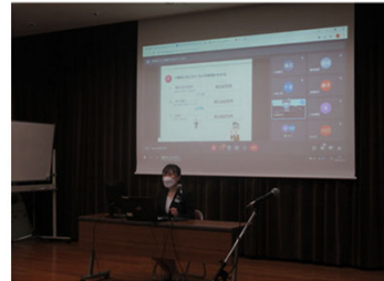
埼玉県内高等学校での協働セミナーの様子