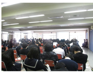
東京都内高等学校での協働セミナーの様子

関東財務局と、S M B Cコンシューマーファイナンス株式会社が協働し、若い世代に向けた金融リテラシーの習得支援として、金融経済教育セミナーを開催。