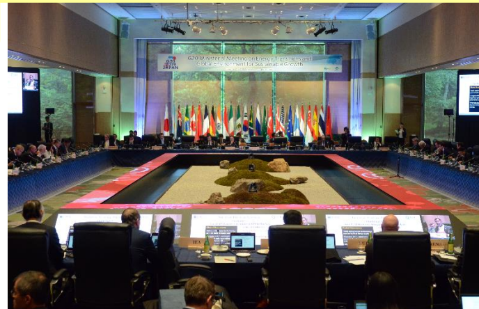
G20持続可能な成長のためのエネルギー転換と地球環境に関する関係閣僚会合 (2019年6月14日 軽井沢町)