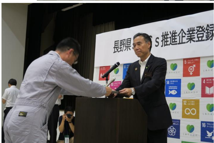
知事から登録証を手交