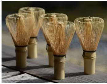
伝統工芸品「高山茶釜」