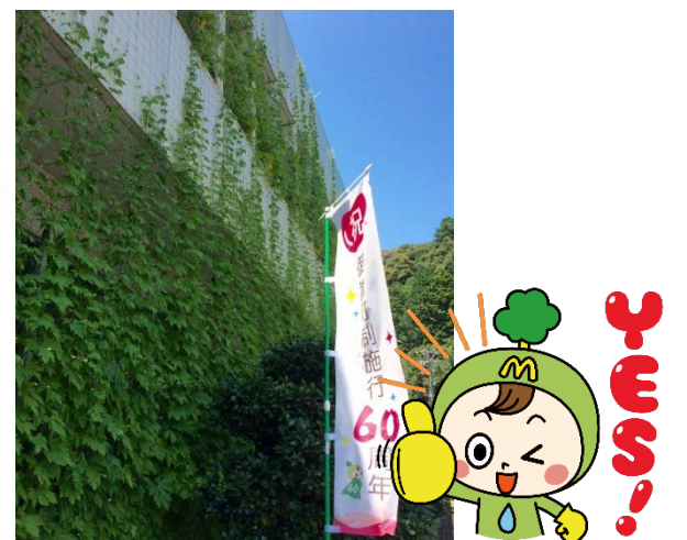
▲ まちのシンボルキャラクター“ミーモくん” ▲