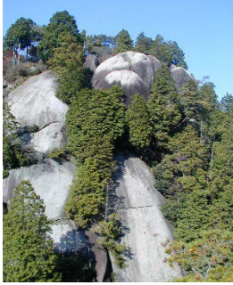
▲ 名勝 鬼岩公園の巨岩