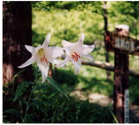
▲ 可憐に咲く ササユリ