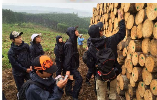
▲ 小中学生への環境学習を積極的に展開