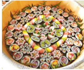
▲ 新たな郷土食 みたけ華ずし