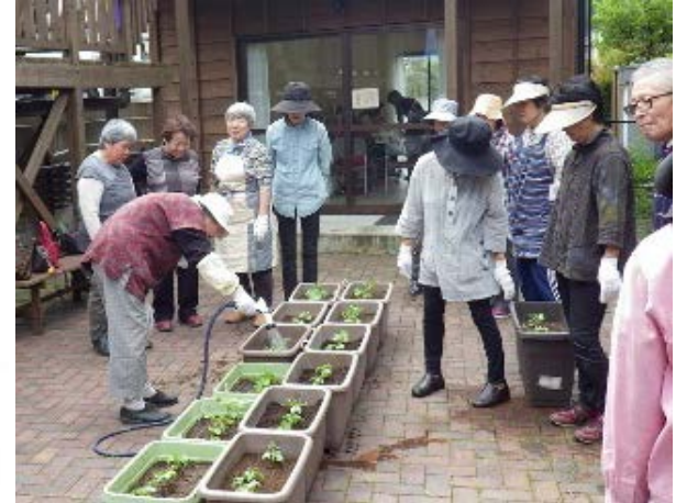
▼ 住民とともに推進しているグリーンカーテンづくり ▲