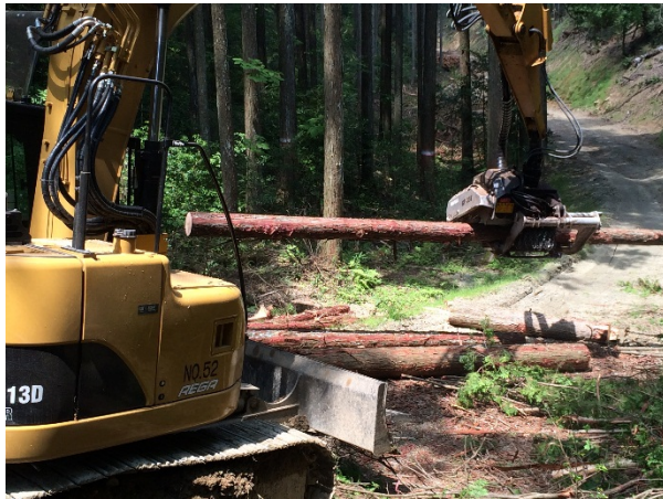
▲ 経営信託事業者による森林整備 ▼

御嵩町が目指す環境モデル都市像の実現のため、住民・事業者・行政が連携・協力しながら各施策を展開している。