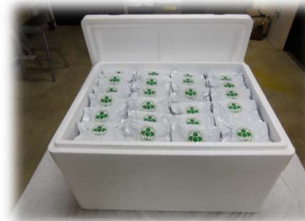
朝倉山椒の海外輸出 累計120kg以上を輸出