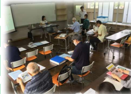
特産品開発セミナーでは、 今までに40人以上が受講